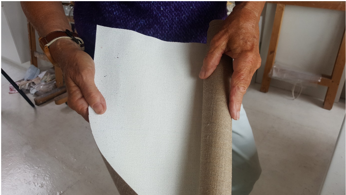
... geprepareerd schilderslinnen op rol ...