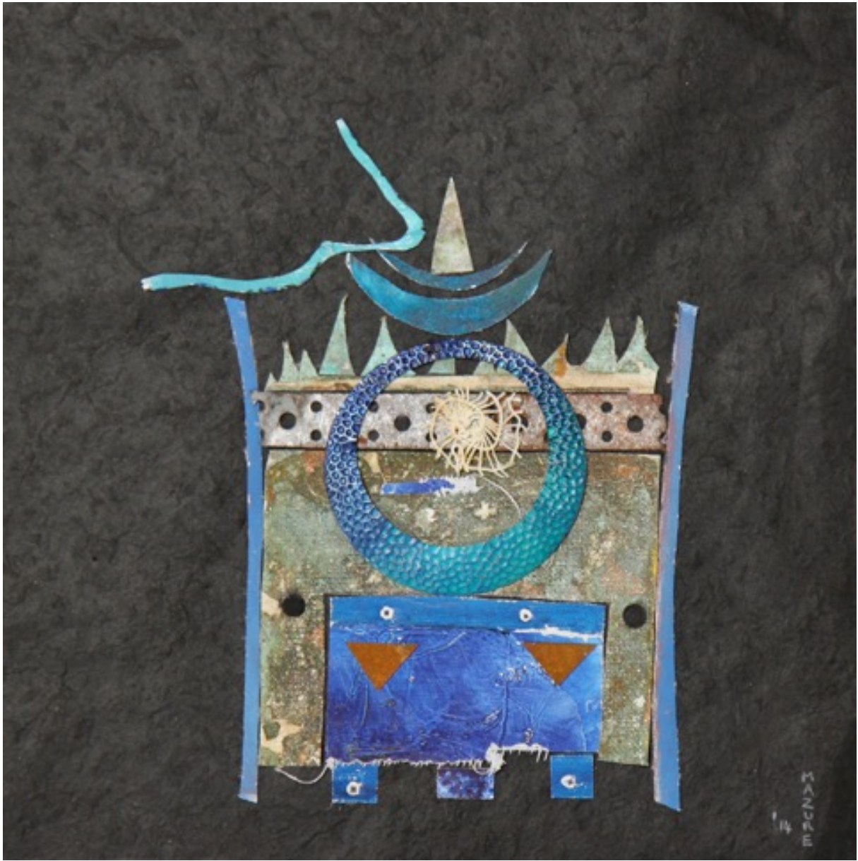
Nacht in Oman, 2018, 30 x 30 cm.