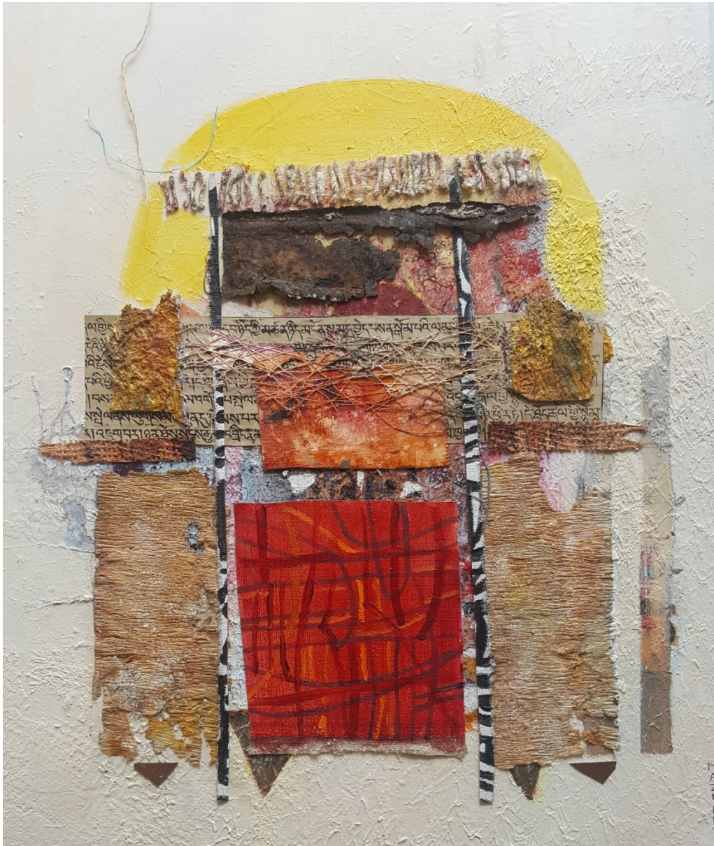
... werk zonder titel nog, met de streepjes, stukje oud ijzer, jute satijndraden, wc-papier uit Oezbekistan en papierfragmenten uit Lhasa ...

“Ik gebruik voornamelijk olieverf en doop de penseel in de tube of druk de verf meteen op het doek uit. Verf is duur, ik wil niets vermorsen. Ik werk met linnen doek op grote rollen. Dat linnen is geprepareerd voor olie- en acrylverf. Ik span zelf het doek op spielatten op in elke gewenste maat, nu vooral in het vierkant. Dat is een heel precies werkje, vergelijk het maar met glas zetten. Het is telkens weer een uitdaging om dan op zo’n leeg wit doek een ‘verhaal in verf’ te starten. Kijk, in dit roze werk zit een ‘rammeltje’, ik vind het eigenlijk een stevige rammel. Daar moet ik nog verder mee. Ik werk dan ook altijd aan verschillende werken tegelijk.”