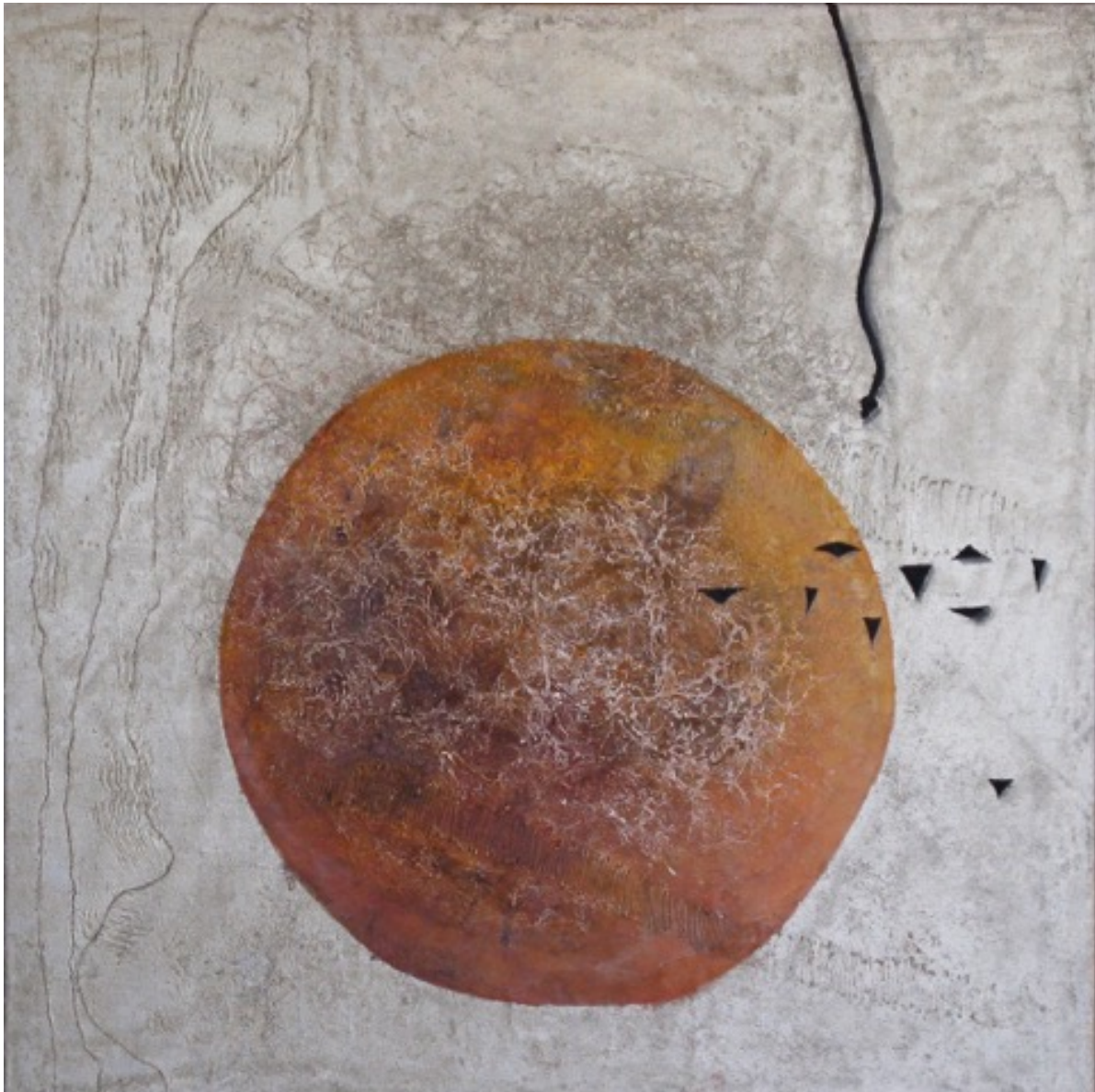
Denkend aan Japan, 2015, 100 x 100 cm.