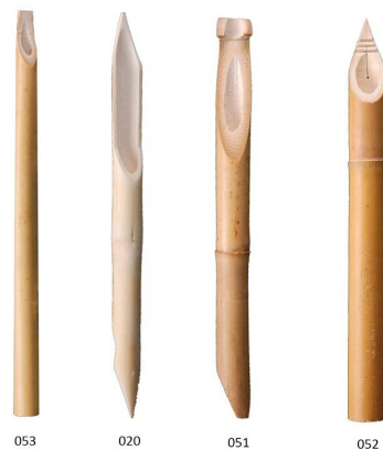
Rietpens