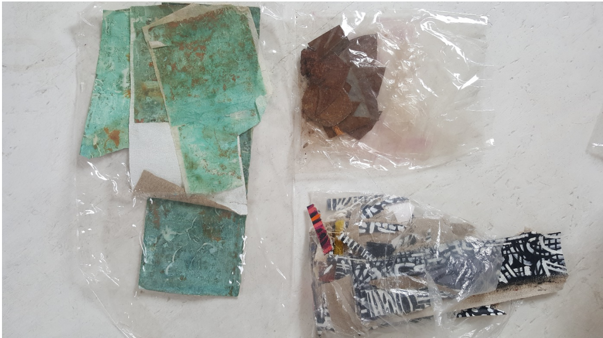
...stukjes bladkoper; bewerkt met chloor; gevonden stukjes oud ijzer en de streepjes ...

“Mijn ‘streepjes-trek-leraar’ werkt nog steeds door. In heel veel schilderijen komen zwart-wit streepjes voor. Die streepjes zet ik op stukjes schilderslinnenafval, dat ik weer in fragmenten verwerk in ander werk. Vroeger waren het zwart-wit streepjes, nu verwerk ik ze ook in kleur. Die streepjes, dat is wel een gek verhaal. Ik had een paar linnen schoentjes die ik aanhad toen ik bij iemand op bezoek ging. Maar het regende onderweg en de schoentjes zagen er na dat bezoek niet meer uit. Ik heb ze toen kapot gescheurd en dacht ‘daar kan ik iets mee’ en zo ben ik ze gaan verwerken in mijn werk.”