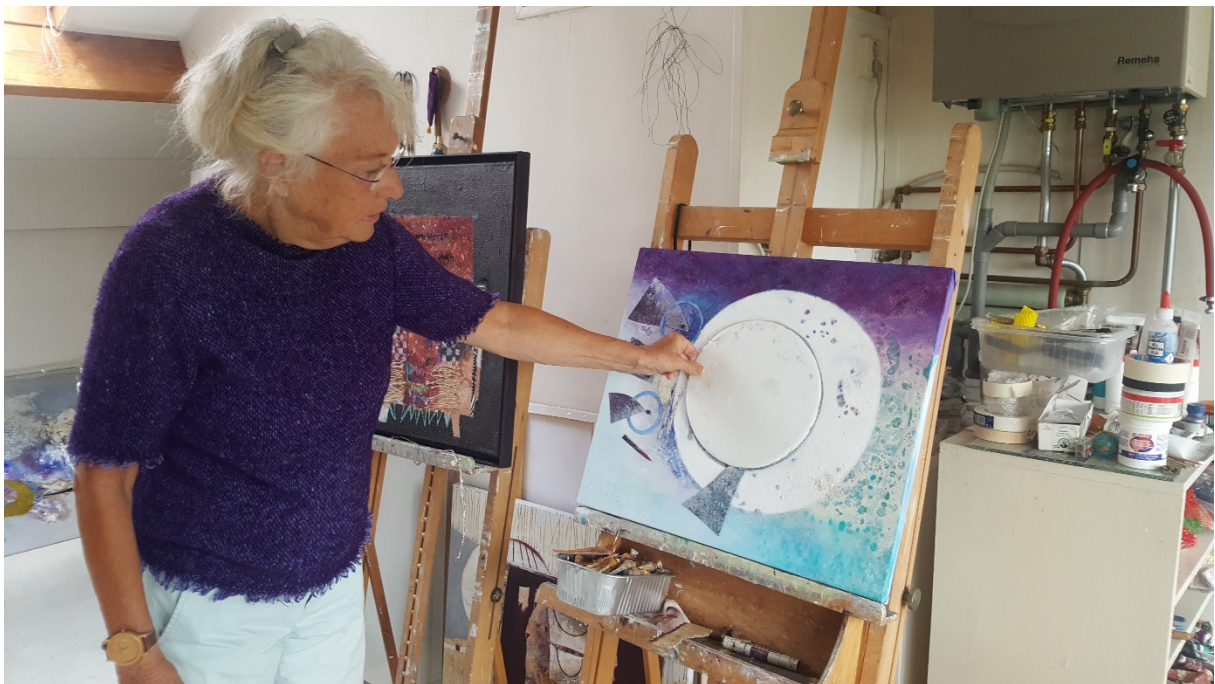
...ook een pizzabodem is handig om een compositie mee te bepalen ...

“Een meer recent werk heet Herinneringen aan een oud tapijt . Met potlood heb ik een web getekend. In dit werk speelt de ‘huid’ van de verf een grote rol: ik heb de verf hier dik, pasteus opgebracht. En een ander werk is geïnspireerd op werk van Mark Rothko met zijn grote kleurvlakken. Ik was net naar een tentoonstelling over zijn werk geweest en maakte drie blauwe werken. Daar heb ik vitrage van Ikea in verwerkt. De titel is Herinnering aan Oezbekistan vanwege de blauwen. Perzië heeft de naam, maar Oezbekistan doet daar nauwelijks voor onder: het prachtige blauw in de architectuur, alsof je in een droomwereld