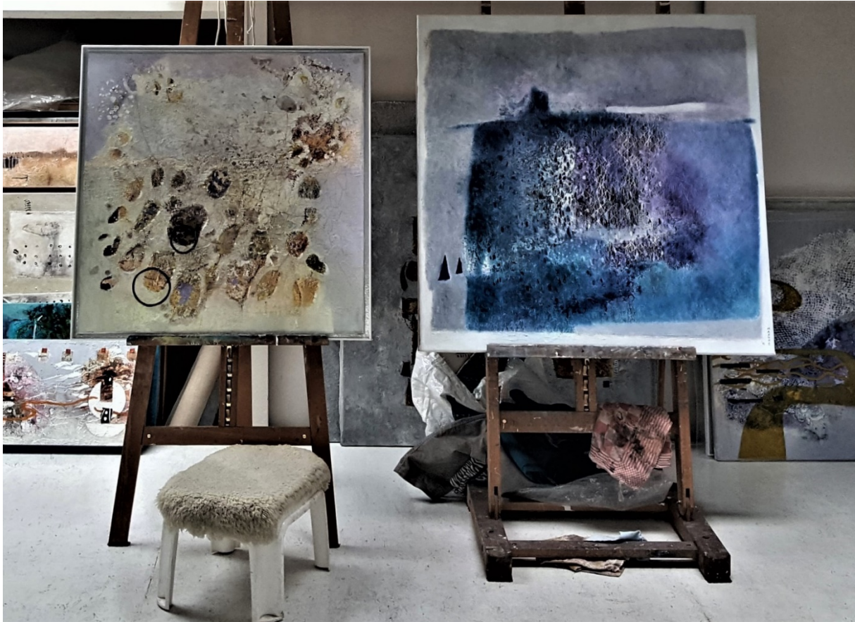
Herinnering aan een oud tapijt, 2020, 70 x 70 cm. Herinneringen aan Oezbekistan/ Geheim van de stilte, 2015, 85 x 85 cm.

bent. De Russen hebben daar veel kwaad gedaan maar wel veel uit de middeleeuwen stammend tegel- en mozaïekwerk is mooi gerestaureerd.”