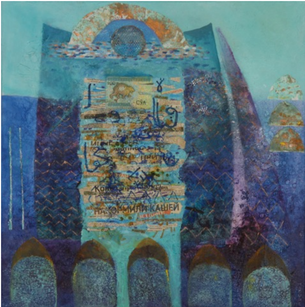
Denkend aan Oezbekistan, 1970, 70 x 70 cm.