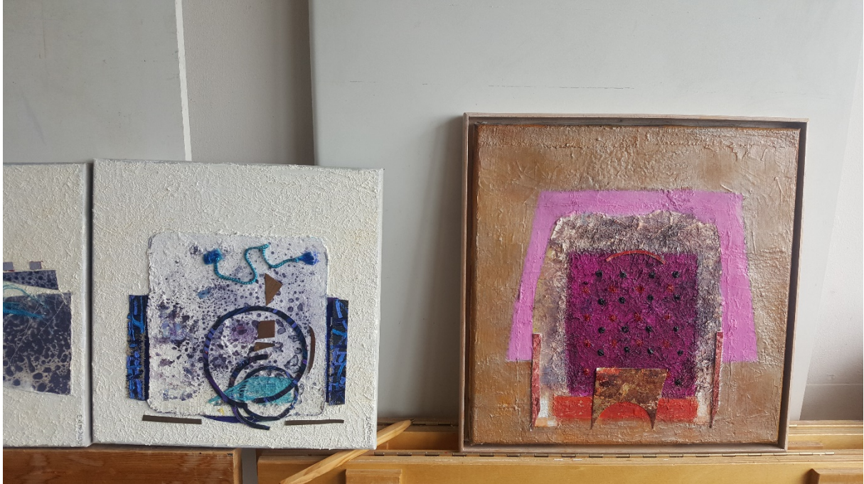
... onaf werk, rechts het roze werk met een rammeltje ...