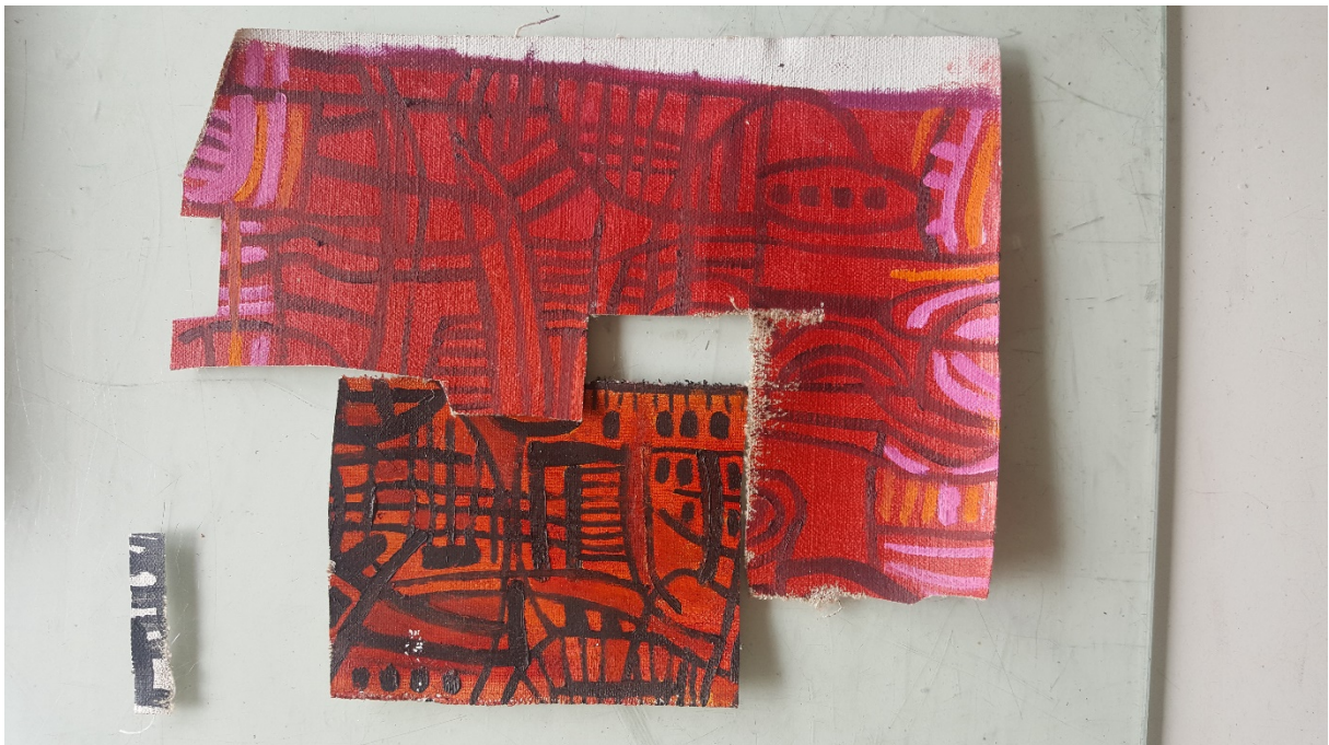
... zwart witte en gekleurde streepjes op resten geprepareerd schilderslinnen ...

“Ik maak nu vooral collages en ben eindeloos aan het schuiven met de materialen. In dit werk dat nog geen titel heeft - op een goede titel moet ik altijd even broeden - zitten gekleurde en zwart-witte streepjes: jute, draadjes van wilde zijde, een stukje gevonden roest, offsetplaatjes bewerkt met roest, teksten, vitrage, stukjes van een oud schilderij, gerecycled wc-papier meegenomen uit Oezbekistan - dat vond ik prachtig, daar zitten allemaal kleuren in - en teksten meegenomen uit Lhasa, de hoofdstad van Tibet. Het zijn fragmenten van afdrukken in lange stroken papier van houten plankjes. Ze kennen daar geen gebonden boeken maar losse vellen die dan in volgorde, in bundels, in felgekleurde doeken worden gewikkeld. Monniken reciteren daar gezamenlijk uit.”