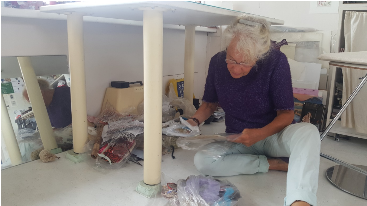
... Fanny's rommelhoekje ...

“Mijn ‘streepjes-trek-leraar’ werkt nog steeds door. In heel veel schilderijen komen zwart-wit streepjes voor. Die streepjes zet ik op stukjes schilderslinnenafval, dat ik weer in fragmenten verwerk in ander werk. Vroeger waren het zwart-wit streepjes, nu verwerk ik ze ook in kleur. Die streepjes, dat is wel een gek verhaal. Ik had een paar linnen schoentjes die ik aanhad toen ik bij iemand op bezoek ging. Maar het regende onderweg en de schoentjes zagen er na dat bezoek niet meer uit. Ik heb ze toen kapot gescheurd en dacht ‘daar kan ik iets mee’ en zo ben ik ze gaan verwerken in mijn werk.”