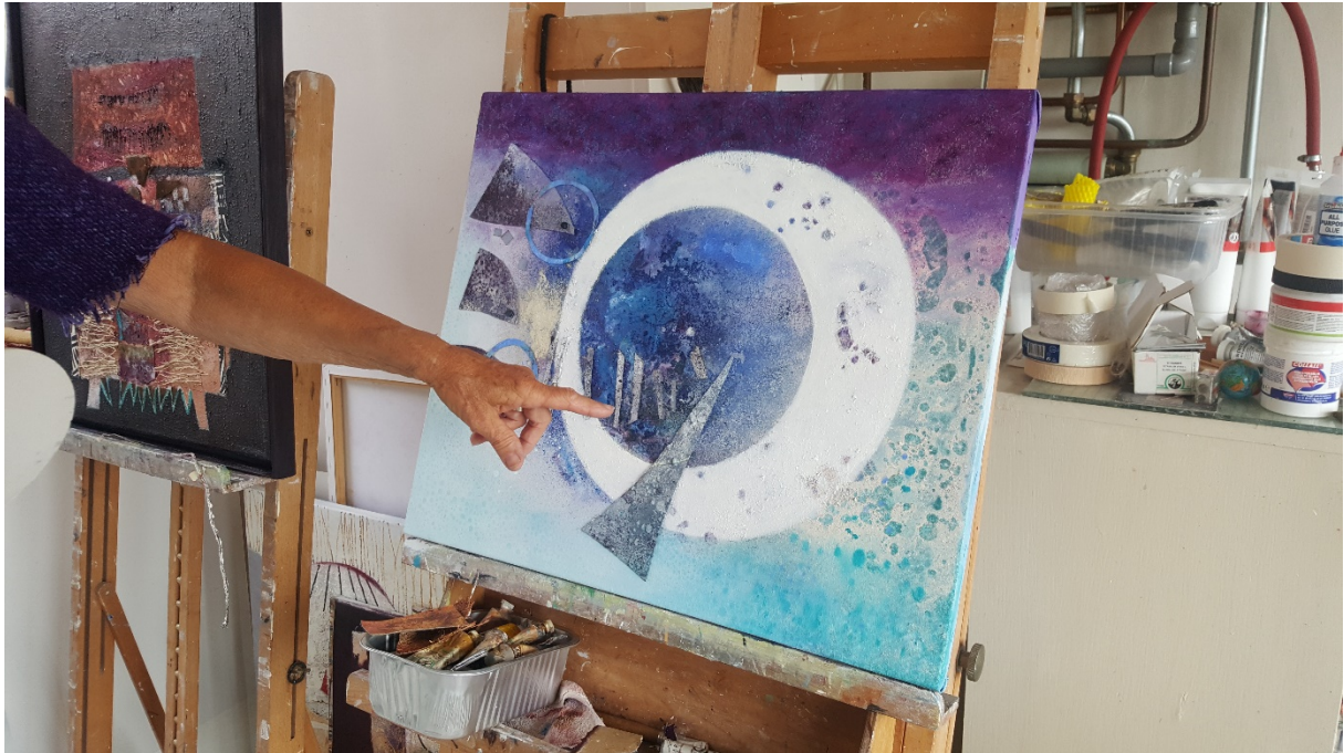
Blik in de ruimte, 2020, 50 x 60 cm.